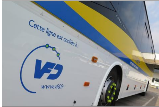
L'horizon s'éclaircit pour les VFD.

ISÈRE | Le Département a tranché Bonne nouvelle pour les VFD