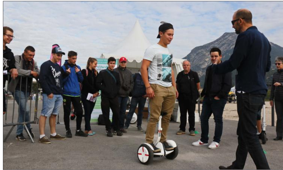
La deuxième journée hier était exclusivement dédiée au jeune public avec un parcours citoyen organisé sur le site du CEA au cœur de la Presqu'île.